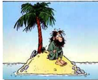
Lerninsel für Selbststudium